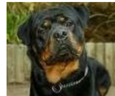
E' normale aver paura del cane?

Per esempio: la reazione all'attacco di un cane rottweiler si chiama paura, la stessa reazione di fronte ad una formica, si definisce fobia!